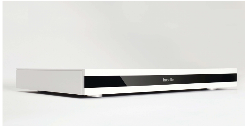
Basalte Core S4 (oben) und Core Mini: die grauen, nein weißen Eminenzen im Hintergrund eines Smart-Home-Systems von Basalte

es bisher in zwei Varianten: den Basalte Core S4 Server und den kompakten Core Mini. Letzterer ist reduzierter in der Steuerung, der Basalte Core S4 ist erheblich leistungsfähiger und somit für unsere meistens sehr komplexen Projekte immer ein willkommener Bestandteil unserer Basalte-basierten Konzepte und bietet hier eine beachtliche Erweiterung der Möglichkeiten. Auch ist hier das gradlinige Design hervorzuheben, das selbstverständlich perfekt mit den KNX-fähigen Verstärkern von Basalte im Einklang läuft und sich aus meiner Sicht atemberaubend von anderen Herstellern unterscheidet.