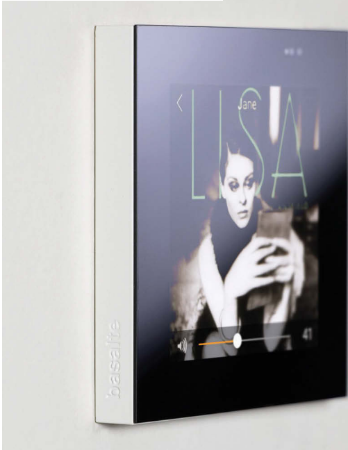
Basalte LISA: kompaktes Bedienpanel mit voller Funktionalität in schickem Kleid