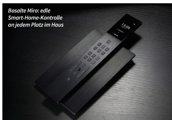
Basalte Miro: edle Smart-Home-Kontrolle an jedem Platz im Haus

Ein weiterer Pluspunkt von Basalte Home ist die attraktive und absolut intuitive Benutzeroberfläche für die komplette Haussteuerung. Die hierfür speziell entwickelten Steuerungszentralen gibt